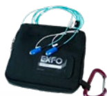
Conditionneur de lancement externe au flux inscrit (EF) SPSB-EF-C30