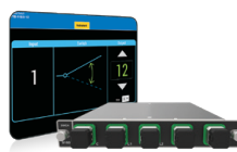
MEMS光开关 FTBx-9160 (1 x 2、1 x 4配置)