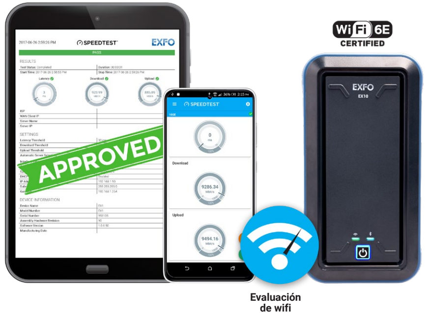
Evaluación de wifi

■ El EX10 ayuda a los técnicos in situ a validar con facilidad las velocidades de banda ancha de hasta 10 Gigabit Ethernet (incluidos GPON y XGS-PON) y evaluar el wifi 6E residencial para monitorear la calidad de la experiencia residencial (QoE).