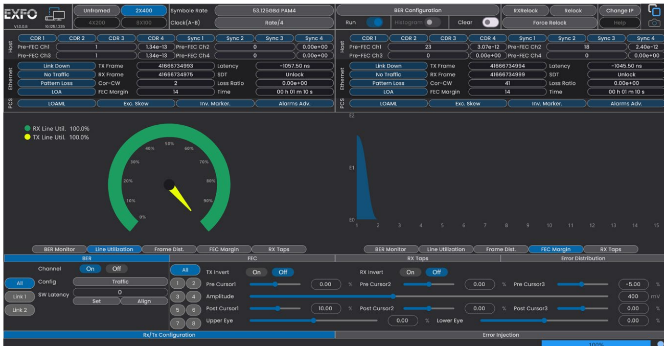
図 4. テスト前後の FEC BER、シンボルエラー分布、および FEC マージン。

RX/TX フレーム・カウントや回線利用率などの主要パラメーターをモニター。リアルタイムの FEC 解析は、FEC 前後の BER、シンボル・エラー分布、FEC マージンのテストを提供します。