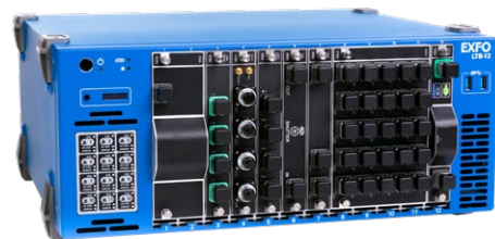
LTB-12十二插槽机架式平台

WINDOWS环境 | 内置的应用 | 第三方应用 可扩展 | 可热插拔模块 | USB