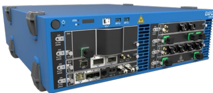
LTB-8八插槽机架式平台